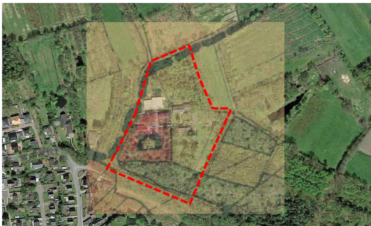
Abbildung 4: Luftbild mit Lage des Plangebiets (rote Umrandung), genordet, ohne Maßstab.