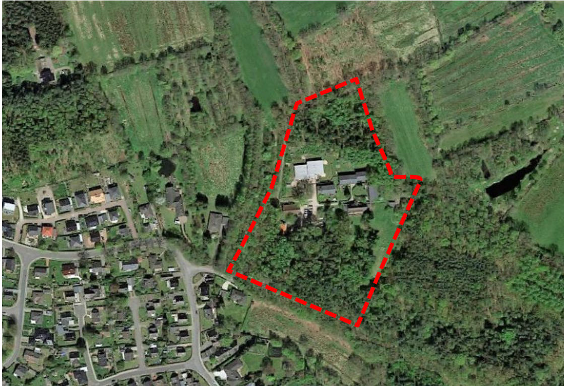
Abbildung 1: Luftbild mit Lage des Plangebietes (rote Umrandung), ohne Maßstab, Quelle: Google Earth